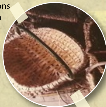
Illustration des fonds de page : tableau de fleurs séchées de Benjamine Guzzo - Crédits photo : L. Chaber, A. Jullion, Cl. Burgain-SapiensSapiens, E. Pointel, source internet. Conception et réalisation du programme : Caroline Sellier et Amanda Jullion pour « Les Herbes Sourcières ».

Inscription obligatoire sur notre site www.rencontresavoirplantes.fr (places limitées)